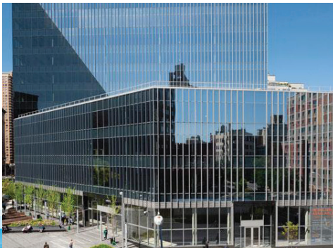
51 Astor 25 Rue Cooper, New York, NY 10034, United States