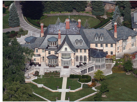
Edgemere 1502 Chemin Lakeshore E. Oakville, Ontario, Canada