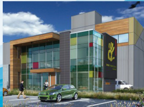
Tricentris, Lachute Chemin Félix-Touchette, Lachute, Québec, Canada