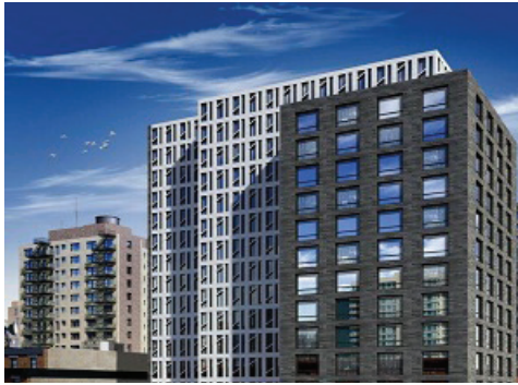
444 10 e Avenue Nord New York, NY 10001. USA

Nous sommes fier fournisseur des projets suivants, soient terminés ou en cours de projets :